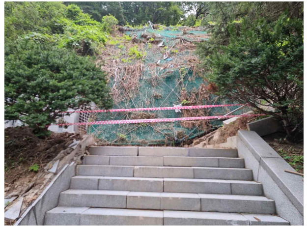
301동 후면 낙석 위험 통행 제한