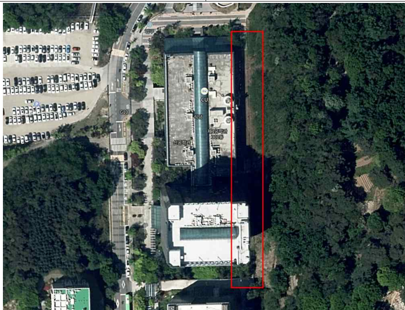
301동 후면 추가 낙석 및 붕괴 위험 통행 제한